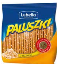
Paluszki Lubella Z sezamem 220g