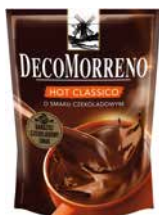
DecoMorreno torba Hot Classico 150g