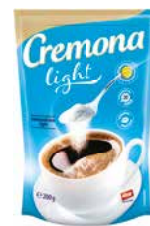
Cremona Light 200g