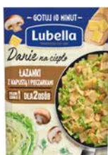
Danie na ciepło Łazanki z kapustą i pieczarkami 190g