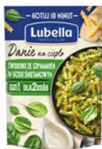
Danie na ciepło Świderki ze szpinakiem w sosie śmietanowym 190g