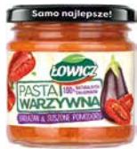
Łowicz Pasta warzywna bakłażan & suszone pomidory 180g