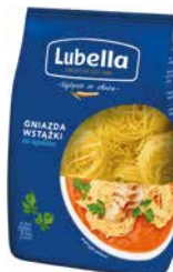
Makaron Lubella Classic