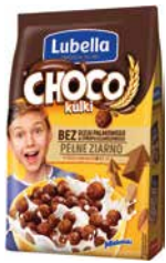
Choco Kulki 250g