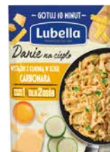
Danie na ciepło Wstążki z cukinią w sosie Carbonara 190g