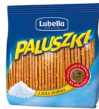
Paluszki Lubella Z solą 275g