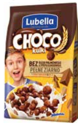
Choco Kulki 500g