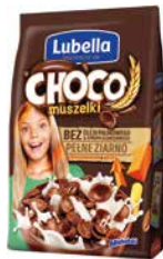
Choco Muszelki 250g