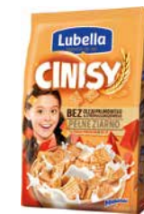
Cinisy 500g do wyczerpania zapasów w kanale tradycyjnym