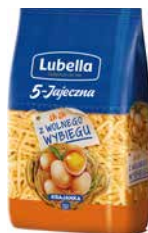
Lubella 5 Jajeczna Krajanka 400g