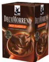
DecoMorreno kartonik Hot Classico 250g