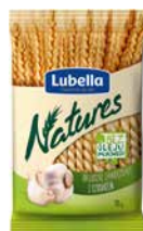
Paluszki Lubella Natures Z czosnkiem 70g