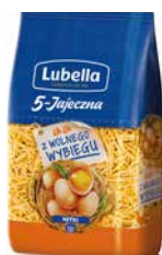
Lubella 5 Jajeczna Nitka 400g