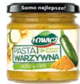
Łowicz Pasta warzywna cukinia & curry 180g