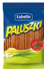
Paluszki Lubella Z cebulką i serem 70g