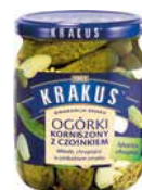
Krakus Ogórki Korniszony z czosnkiem 500g