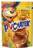
Napój kakaowy 300g