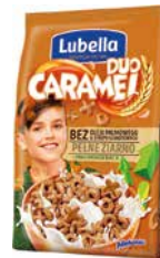
Duo Caramel 250g do wyczerpania zapasów