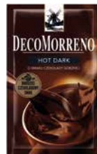
DecoMorreno Dark 25g