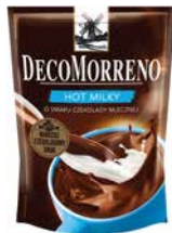
DecoMorreno torba Hot Milky 150g