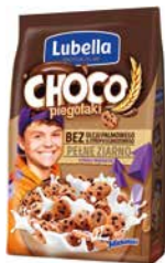
Choco Piegotaki 250g