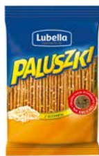
Paluszki Lubella Z sezamem 70g