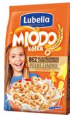
Miodo Kółka 250g