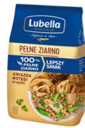
Pełne Ziarno Gniazda wstążki 400g