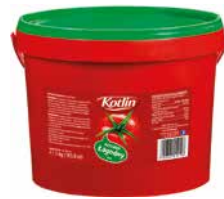
Kotlin Ketchup Łagodny 3000g