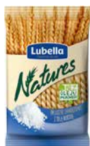
Paluszki Lubella Natures Z solą morską 70g