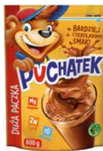
Napój kakaowy 600g