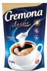
Cremona Classic 200g