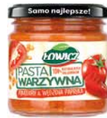
Łowicz Pasta warzywna pomidory & wędzona papryka 180g