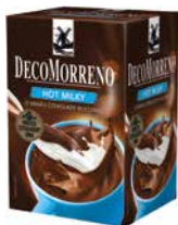
DecoMorreno kartonik Hot Milky 250g