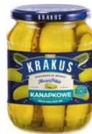
Krakus Ogórki Pikle kanapkowe 670g