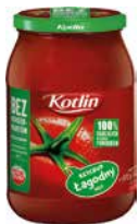
Kotlin Ketchup Łagodny 970g