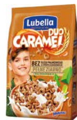
Duo Caramel 500g do wyczerpania zapasów w kanale tradycyjnym