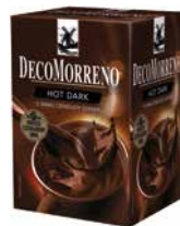
DecoMorreno kartonik Hot Dark 250g