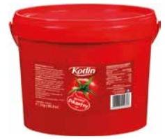
Kotlin Ketchup Pikantny 3000g