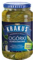
Krakus Ogórki Konserwowe 920g