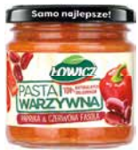
Łowicz Pasta warzywna papryka & czerwona fasola 180g