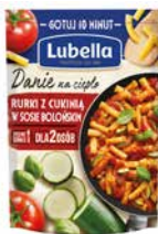
Danie na ciepło Rurki z cukinią w sosie bolońskim 190g