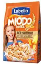
Miodo Kółka 500g