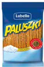
Paluszki Lubella Z solą 70g