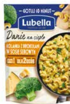
Danie na ciepło Kolanka z brokułami w sosie serowym 190g