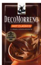
DecoMorreno Hot Classico 25g