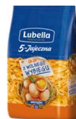
Lubella 5 Jajeczna Wstążki 400g