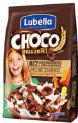
Choco Muszelki 500g