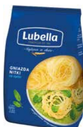
Makaron Lubella Classic