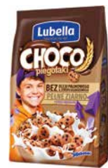
Choco Piegotaki 500g