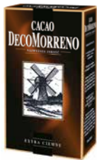
Kakao kartonik 150g