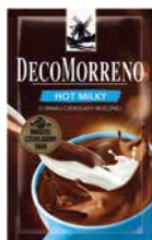
DecoMorreno Hot Milky 25g